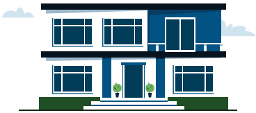
Renting temporary housing