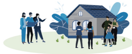
Reparación de viviendas no aseguradas o sin suficiente cobertura de seguro