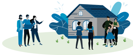
Repairing uninsured or underinsured homes