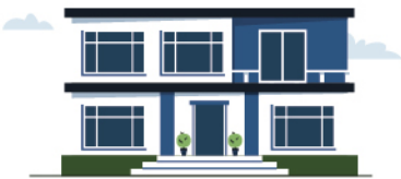
Pago del alquiler de vivienda provisional