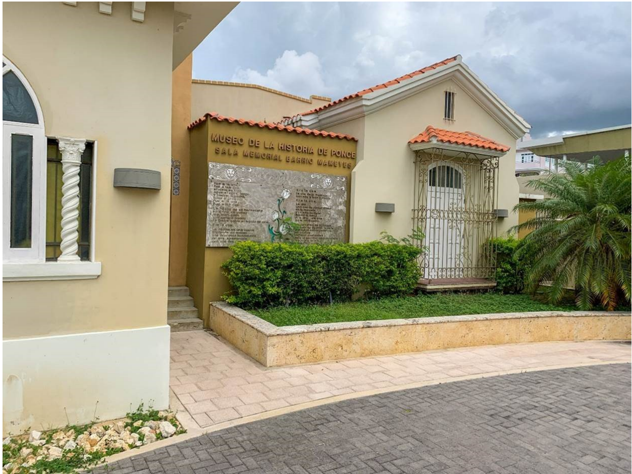
PONCE, Puerto Rico – También se aprobaron por FEMA $102,000 para reparar los museos Casa Zapater, la Sala Memorial del Barrio Mameyes y la Casa Salazar en el centro histórico de Ponce.